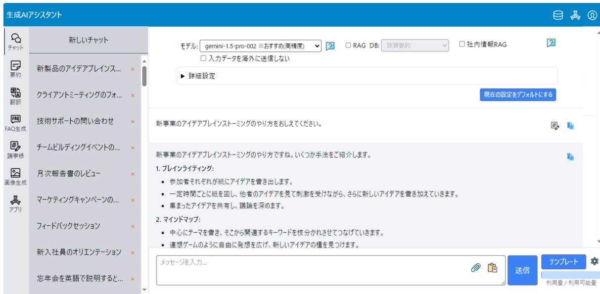
図. 生成 AI アシスタント画面イメージ（左側メニューから翻訳他の業務を選定、画面上部から生成 AI モデルの選択が可能）